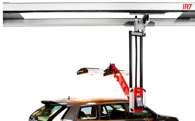
IRT 3-20 PcD

Para recibir más información contactar con: Departamento de Comunicación Ainet Canut Tel. 93 843 99 41 / 93 843 99 94 E-mail: marketing@reauxi.com www.reauxi.com