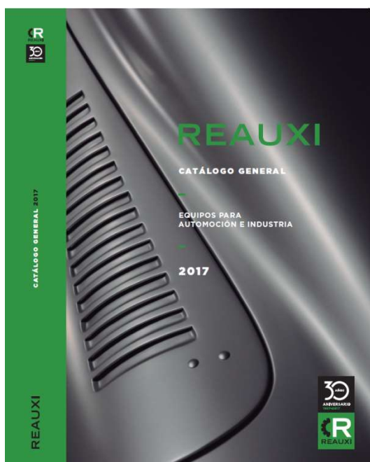
FOTO 1- Portada Catálogo