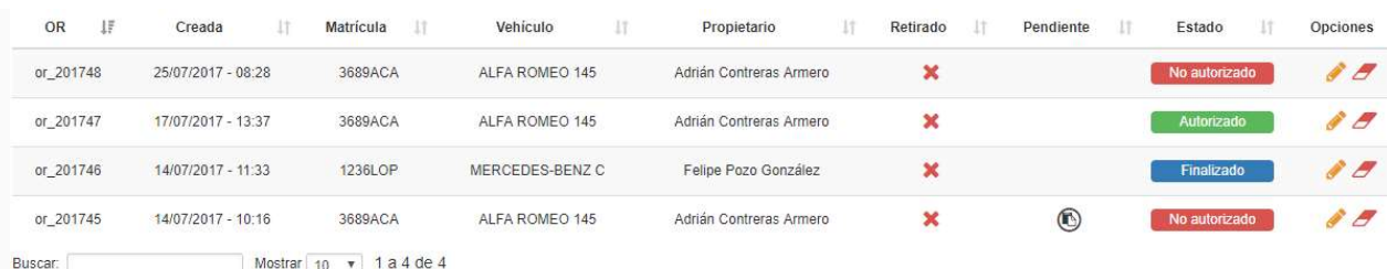
Fig 1. Lista de ORs