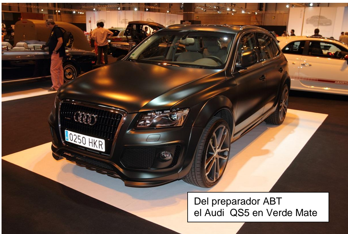
Del preparador ABT el Audi Q5 en Verde Mate

Recientemente hemos podido ver en el salón del automóvil de Madrid 2012 de la mano del importador para España " MT PERFORMANCE " de las firmas ABT, BRABUS, HAMANN, MOVIT, THECART, varios modelos con acabados Mate.