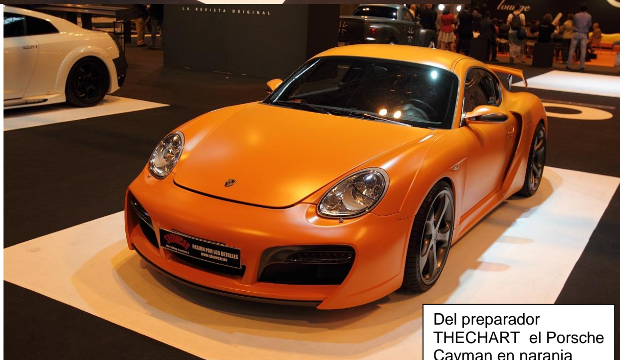
Del preparador THECHART el Porsche Cayman en naranja satinado